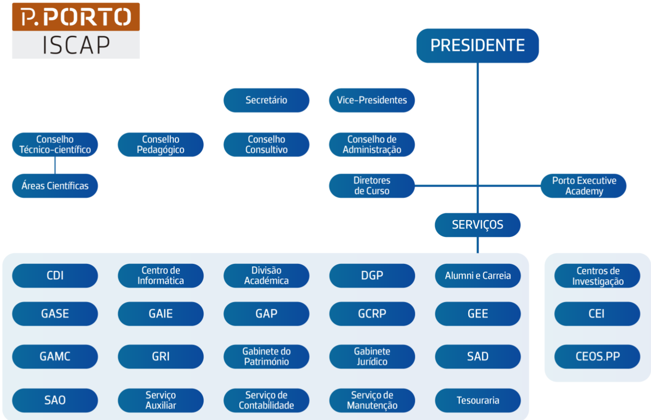
Figura 1 – Organograma do ISCAP