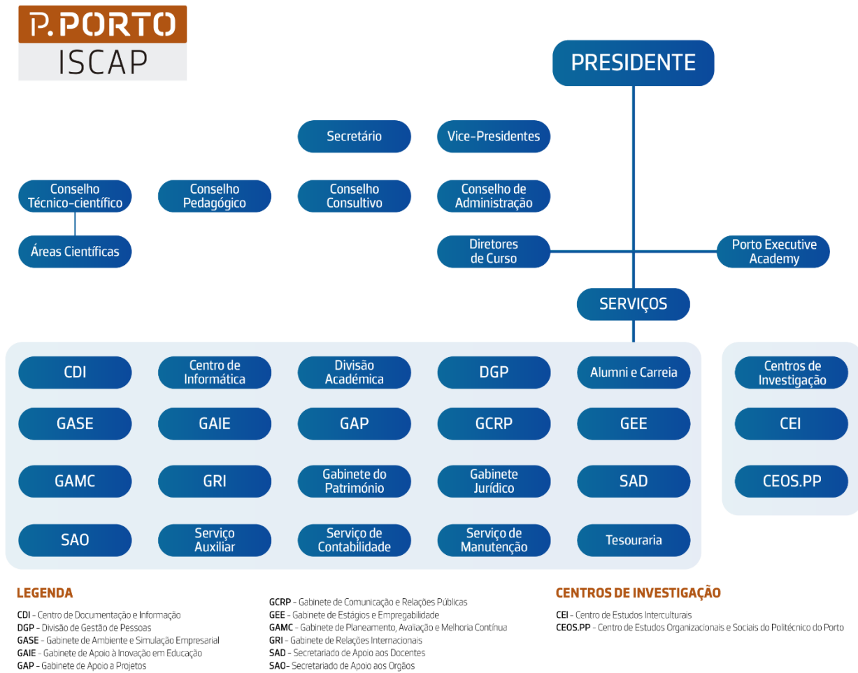
Figura 1 – Organograma do ISCAP